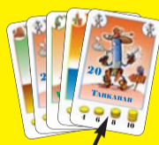
Ez az első lap!